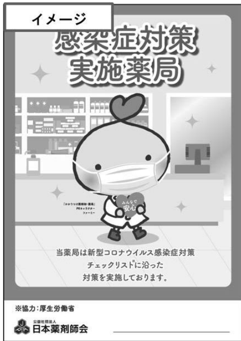
みんなで安心マーク

日本薬剤師会では、新型コロナウイルス感染が拡大している状況下でも、患者さんが安心して薬局に 来局できるよう『新型コロナウイルス感染症等感染防止対策実施薬局 みんなで安心マーク』を作成し、 感染防止対策を徹底し、チェックリストを満たした薬局に向け、発行できるよう準備を進めています。 詳細は9月上旬～中旬にも本会のホームページにて、ご案内する予定です。