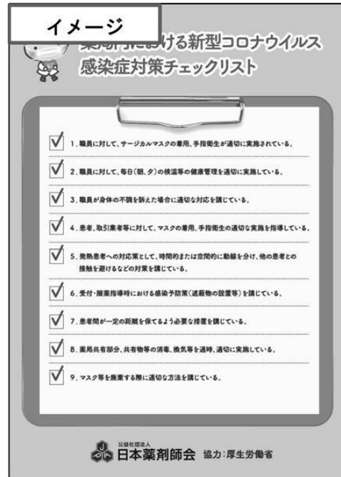
薬局内における新型コロナウイルス 感染症対策チェックリスト

※ 上記の「みんなで安心マーク」、「薬局内における新型コロナウイルス感染症対策チェックリスト」は、 いずれもイメージです。デザイン等は変更の可能性があります。