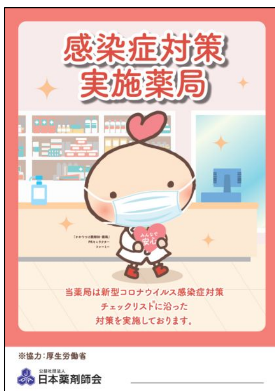
みんなが安心マーク

本会が作成する同マークについては、「薬局内における新型コロナウイルス感染症対策チェックシート【第二版】」及び「薬局内における新型コロナウイルス感染症対策チェックリスト」(項目は別紙3を参照)の全ての項目を実践していることを自己確認の上、同マークとともに「薬局内における新型コロナウイルス感染症対策チェックリスト」を掲出することで使用が可能となっている。