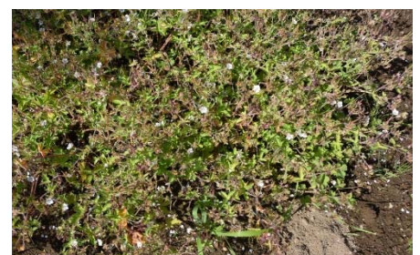
繁茂する現証拠 (三年生で1株の直径80cm)