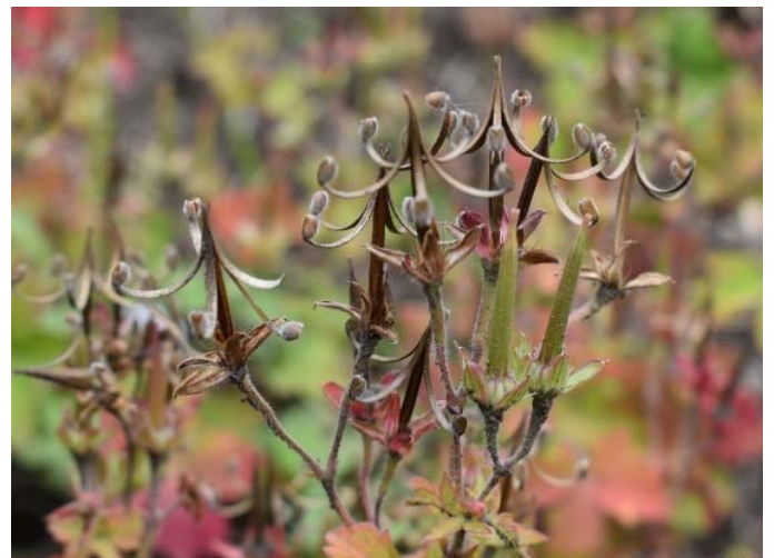
ゲンノショウコの種子

ゲンノショウコは、日本各地の野原や山、道端などの日当たりの良い所に、ごく普通に自生するフウロソウ科の多年草である。春根生葉が芽生え、成長するに従い茎は地面を這うようにして増殖する。一株の大きさは一年草は20cm程であるが、3年草は60cm以上に成長し、葉柄のある葉を対生する。葉及び茎には毛がある。夏、枝先や葉間に花柄を出し2~3個の梅に似た花をつける。花の色は地域により白色、紅紫色、淡紅色で5弁の可愛いらしい花である。花が終わると長くちばし状の蒴果を結び、熟すると裂開して、各々1個の種子をもつ五つの穀片はその柄が軸を離れ、ただくちばしの先に付着し、しかも外側へ巻いて種子を飛ばす。