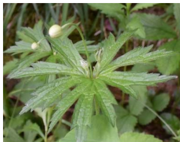
イチリンソウの葉