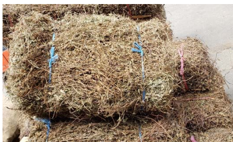
生薬問屋に搬入された佐久産の現証拠