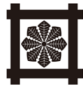
主な葺の家紋：左から五つ葺、雪輪に六つ葺、八つ葺、平井筒に八つ葺